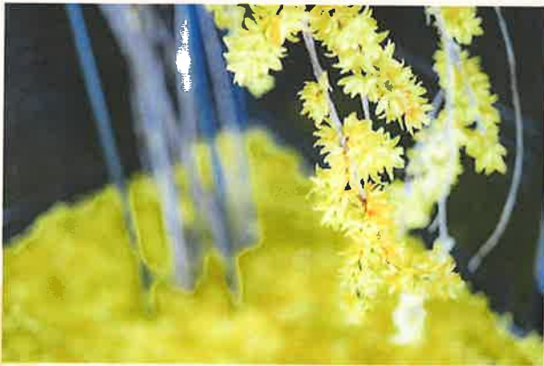
散りゆく花 布花創家 相川千里