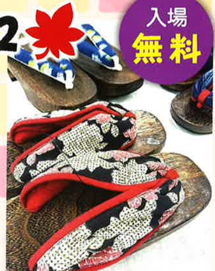
広島県はきもの協同組合