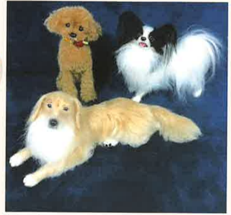
中山みどり認定講師 羊毛刺繍作家 ひらいひろみ