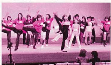
オーディション風景

担当はこんな調子ですが、ステージに立つ子どもたちは元気いっぱいです。この様子なら、当然、本番も大成功でしょう!! 皆さん、楽しみに待っていてくださいね。