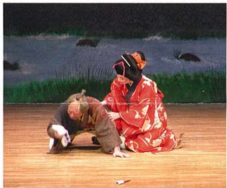
'06演劇・ミュージカルの祭典より

邦楽とは箏や尺八、鼓、絃など日本の伝統的な楽器を使用した音楽です。日本舞踊は歌や音楽に合わせて舞い踊る、いわば日本のダンスで、数多くの流派があります。県内各地から選ばれた様々な流派の団体が一堂に会し、演技を競います。優雅で熱のこもった演技を皆さんも是非一度ご覧ください。