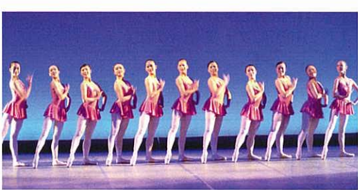
'06洋舞フェスティバルより

民謡民舞の祭典では、広島県の各地域に謡い継がれる民謡や民舞をご覧いただけます。今年も県内各地から選ばれた30社中が出演し、日頃の練習の成果が十分に発揮された華やかなステージをご覧ください。各地域の風土や慣習の中で培われてきた独特の文化を、いつまでも謡い踊り継ぎ遺していきたいものです。