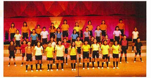
'06ミュージックフェスティバルより